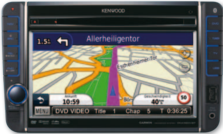
Die Darstellung der Garmin-Navigation ist sehr übersichtlich