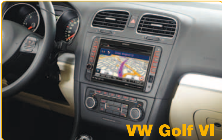
VW Golf VI