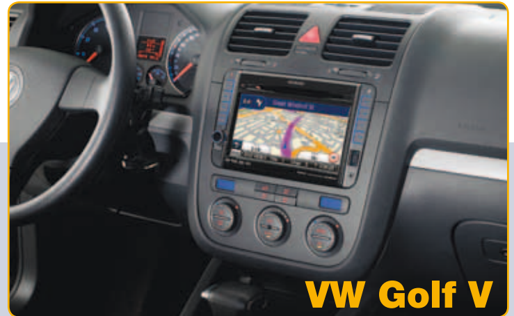
VW Golf V