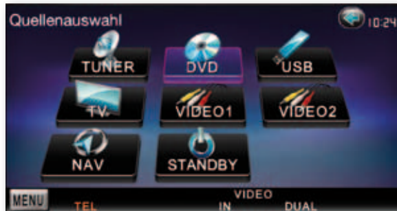
Das volle Multimedia-Programm wird geboten

Das Kenwood besitzt ein Parrot-Bluetooth-Modul und wird damit zur vollwertigen, drahtlosen Freisprechanlage. Bis zu fünf Telefone können registriert werden und verbinden sich dann beim Einschalten des Gerätes automatisch. Telefonbuch und SMS werden unterstützt. Der Ton der Gegenstelle kann wahlweise über alle oder nur über die vorderen Lautsprecher ausgegeben werden. Das beiliegende Mikrofon kann an akustisch optimaler Stelle platziert werden. In unseren Praxistests war die Sprachqualität für beide Parteien ausgezeichnet, die Echo-Unterdrückung funktioniert tadellos.