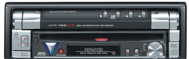
KVT-725DVD im geschlossenen Zustand: Grundbedienung auch bei eingezogenem Anzeigedisplay möglich